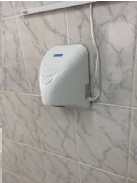
Сушилка для рук неисправная