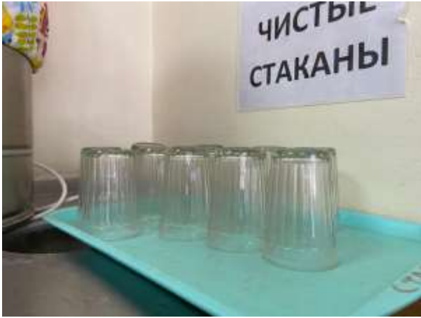
Стаканы без следов загрязнений