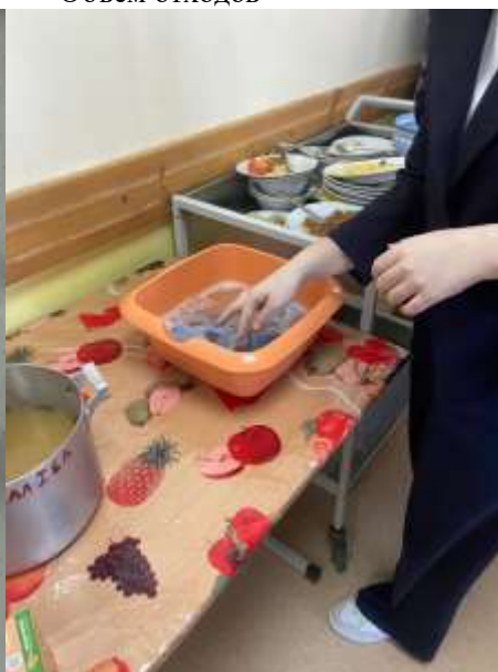
Тазы с хлоркой