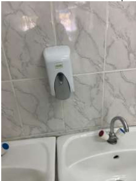
Дозатор пустой или неисправный