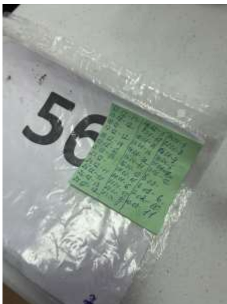
Количество обедающих детей 5Б класс