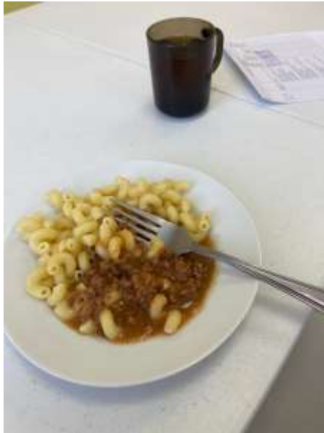
блюда из меню