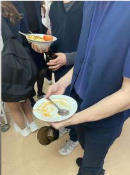
Как едят разные дети